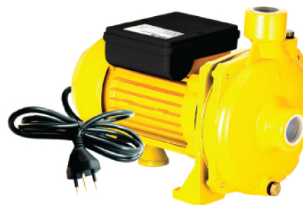
SCM-16 SCM-22 SCM-50